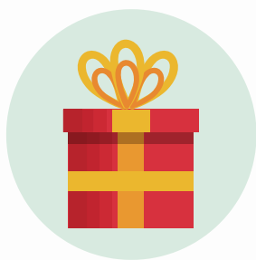
El regalo (prezent)