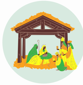
El Belén (szopka)