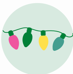
Las luces (światła)