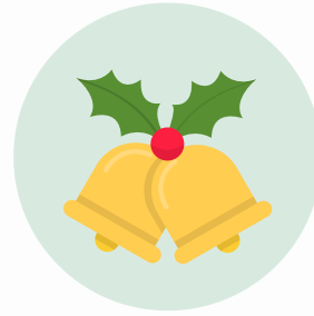
Las campanas (dzwonki)

Życzę Tobie wszystkiego najlepszego z okazji Świąt!