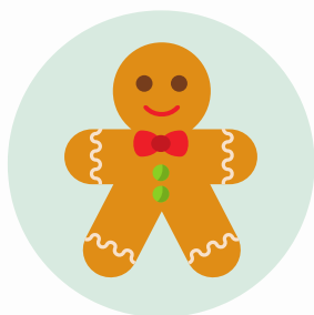
La galleta de jengibre (piernik)