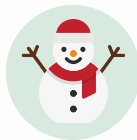
El muñeco de nieve (bałwan)