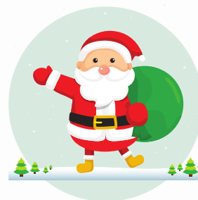
Papá Noel (Św. Mikołaj)