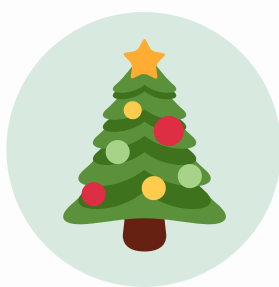
El árbol de navidad (choinka)