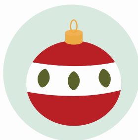
La bola de Navidad (bombka)