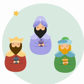
Los Reyes Magos (Trzej Królowie)