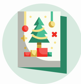
La postal navideña (kartka)